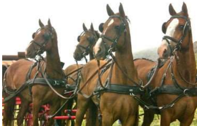
Tiro de cuatro de tostados del Haras Reliance Coach en Sierra de la Ventana

Es difícil explicar la disminución del número de Hackney rosillos. El pelaje, ya sea en la variedad rosillo moro o colorado, no era impopular, e incluso se podía reproducir con algún grado de certeza; una yegua rosilla servida con un padrillo rosillo da un potrillo rosillo en la mayoría de los casos. Comentaba Gilbey que el pelaje rosillo era más frecuente como resultado del cruzamiento entre dos rosillos. A través de los años proponía la cría de una línea de rosillos consanguínea. El proceso implicaría en gran medida una consanguinidad cerrada; pero consideraba que podía ser muy exitosa. Argentina Solamente dos rosillos se registraron en el Stud book Argentino de la raza, entre los años 2000 y 2010 (0,48%), pero se trata (por lo menos en unos de los casos) de pelos blancos entremezclados dentro del pelaje tostado. También se ven muchos alazanes rosillos, pero no los rosillos moros o rosillos colorados típicos que se veían antiguamente. PROPORCION DE PELAJES EN LA RAZA HACKNEY QUE SE PRODUCEN ACTUALMENTE EN NUESTRO PAIS Pelajes claros: Alazanes con sus variaciones, alazanes tostados, zainos colorados y doradillos: 74% Pelajes fuertes: Zainos, zainos negros, tostados oscuros y picazos: 25,4% Otros: (rosillos): 0,5%