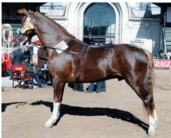
Greenmeadow's Soult, padrillo alazán tostado de la cría de Carlos Lattuada y Cía S.C. Gran Campeón de la Exposición Rural de Palermo en 2009 y 2011.